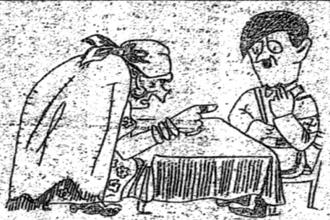
HITLER II WROZKI Rysunek ze "Głębokiej Anegdota"

Poza dyskiem fa- torworków raucowych - jednej omyli, nie- brak wykonopowa- tych "kiszów", z ty- pu anegdot kawiar- zianych. Na wszyst- kich uderza to samo: słowcy występują w nich jako groź- ni, władcy, lecz jako